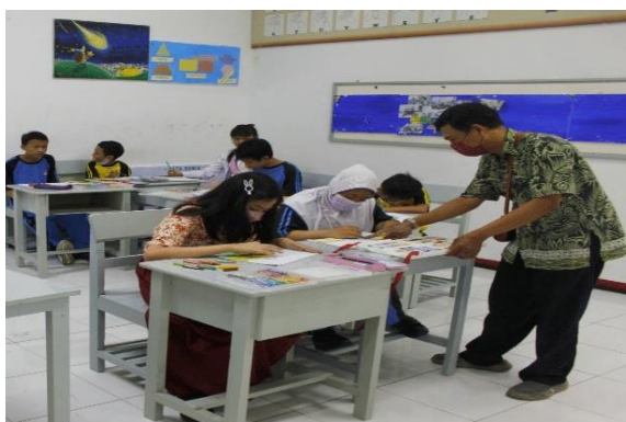
Gambar 3. Aktivitas Pembelajaran Menggambar dengan Pendampingan Guru dalam Kurikulum Merdeka

Dengan demikian, Kurikulum Merdeka menempatkan proses kreatif sebagai inti pembelajaran menggambar. Fokus pembelajaran tidak hanya diarahkan pada pencapaian hasil karya, tetapi juga pada bagaimana peserta didik mengalami proses penciptaan, mengembangkan gagasan, dan membangun kreativitas melalui pengalaman belajar yang bermakna.