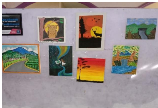
Gambar 1. Dokumentasi Pameran Karya Menggambar Peserta Didik pada Pembagian Rapor Semester Ganjil

Oleh karena itu, Kurikulum 2013 sebenarnya telah menyediakan dasar yang cukup kuat untuk mengembangkan kreativitas peserta didik melalui pembelajaran menggambar. Akan tetapi, implementasinya masih memerlukan penguatan agar proses penciptaan, eksplorasi ide, dan pengalaman berkarya memperoleh perhatian yang lebih besar dibandingkan sekadar pencapaian produk akhir.