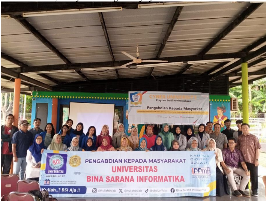
Gambar 2. Foto bersama antara pihak UBSI dengan mitra PKK RW 012 Kelurahan Cibubur

Kegiatan pengabdian masyarakat dilaksanakan pada hari Sabtu, 18 Oktober 2025 menggunakan metode ceramah dengan teknik presentasi materi dilanjutkan dengan diskusi, sedangkan praktikum secara langsung dikemas dalam bentuk workshop. Kegiatan pelatihan berjalan lancar dengan dihadiri oleh 13 peserta dari anggota kelompok PKK RW 012 Kelurahan Cibubur di RPTRA Cibubur Berseri. Peserta pelatihan terlihat antusias dengan materi pelatihan yang diberikan. Hal ini terlihat dari awal hingga akhir acara, semua peserta mengikuti dengan baik. Tahap pertama merupakan tahap analisa awal atau analisa kebutuhan. Pada tahap ini kelompok pengabdian melakukan survey pendahuluan untuk melihat kondisi di lapangan dalam hal ini Kelurahan Cibubur dan wawancara kepada pengurus PKK RW 012 dan pengelola RPTRA Cibubur Berseri. Dalam tahap ini dicari kendala dan permasalahan yang dihadapi oleh para kader dan pengurus dalam pengelolaan survey, setelah itu membuat pengajuan proposal kegiatan pengabdian berdasarkan analisa kebutuhan. Tahap selanjutnya merupakan tahap persiapan kegiatan pengabdian yang meliputi persiapan tempat pelaksanaan, materi pelatihan, absensi panitia dan peserta dan spanduk. Tahap berikutnya adalah proses pelaksanaan pengabdian dengan metode workshop, diskusi, dan tanya jawab. Peserta melakukan kegiatan pembuatan survey menggunakan Google Form dalam bentuk pelatihan yang disampaikan oleh tutor yang dibantu dan didampingi oleh dosen dan mahasiswa, dilanjutkan dengan tanya jawab/diskusi.